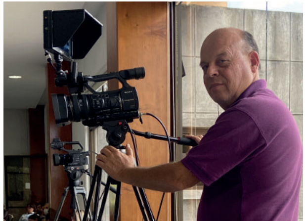
Klibia, de El Salvador, y el equipo técnico al completo.