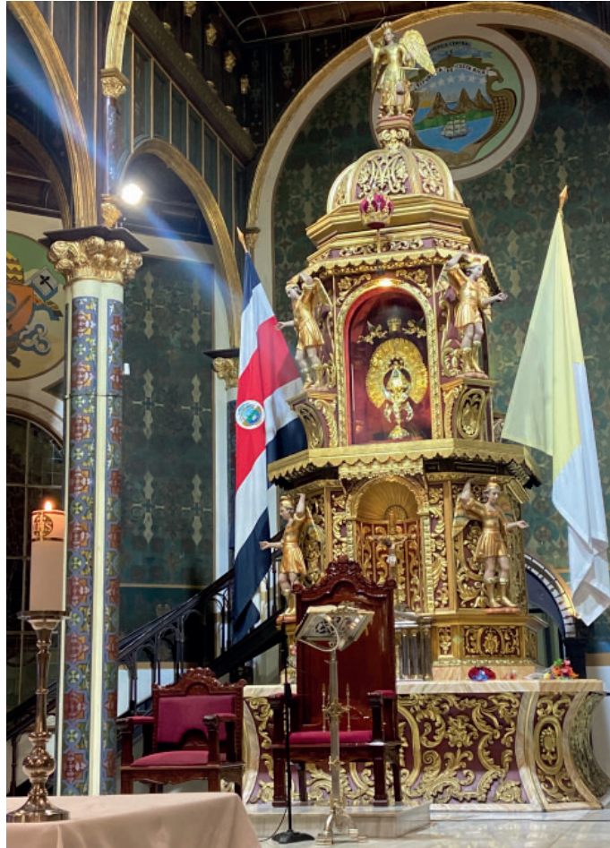
Imagen de Nuestra Señora de los Ángeles.

Cada uno de los participantes del encuentro recibió de regalo una imagen de la Virgen de los Ángeles, la patrona del país anfitrión.