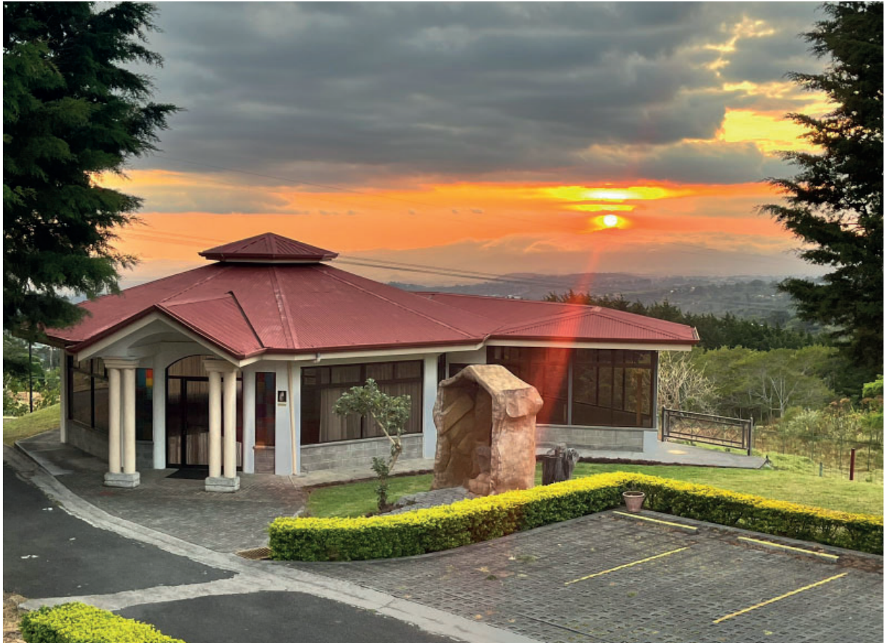
Casa Siloé, pabellón donde se celebró el V retiro de Sacerdotes en la Escuela de María