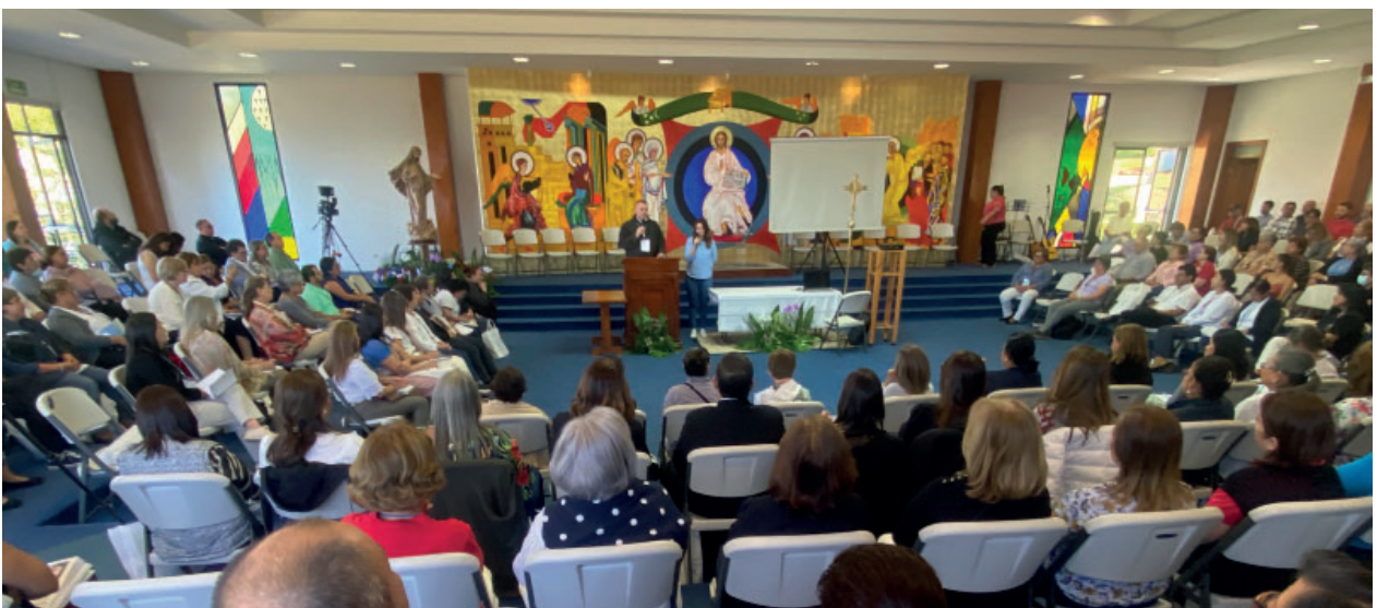
Vista general de la sala de conferencias