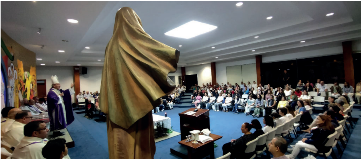
Un espacio de oración y formación