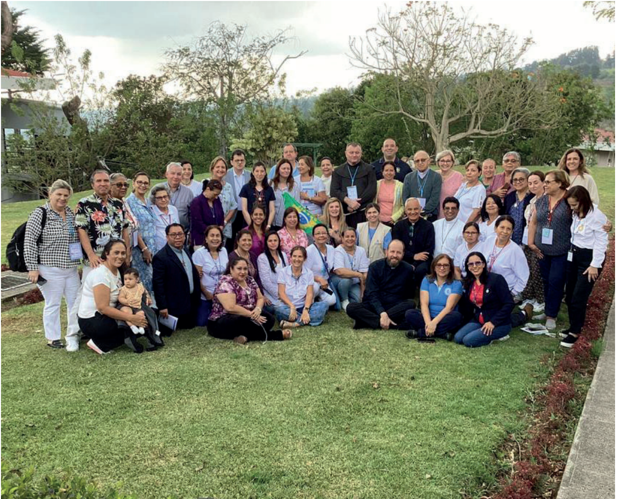
Representantes de 23 países iberoamericanos