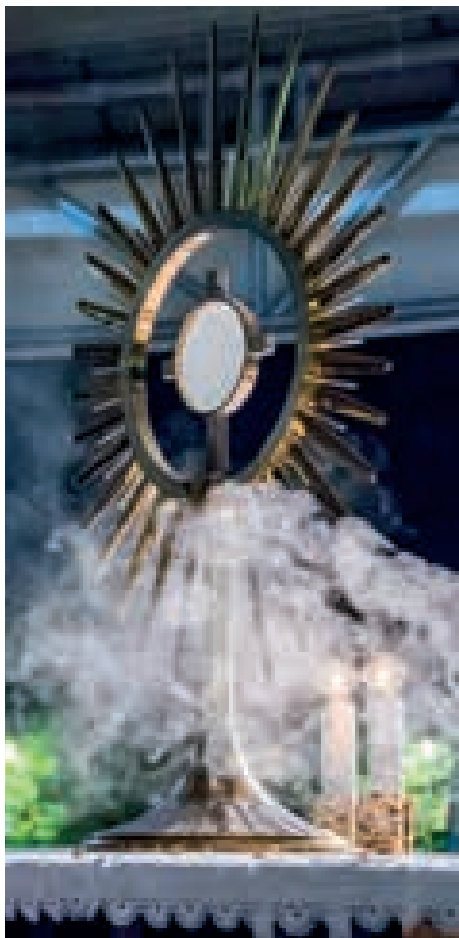
Jesus, Adoramus Te