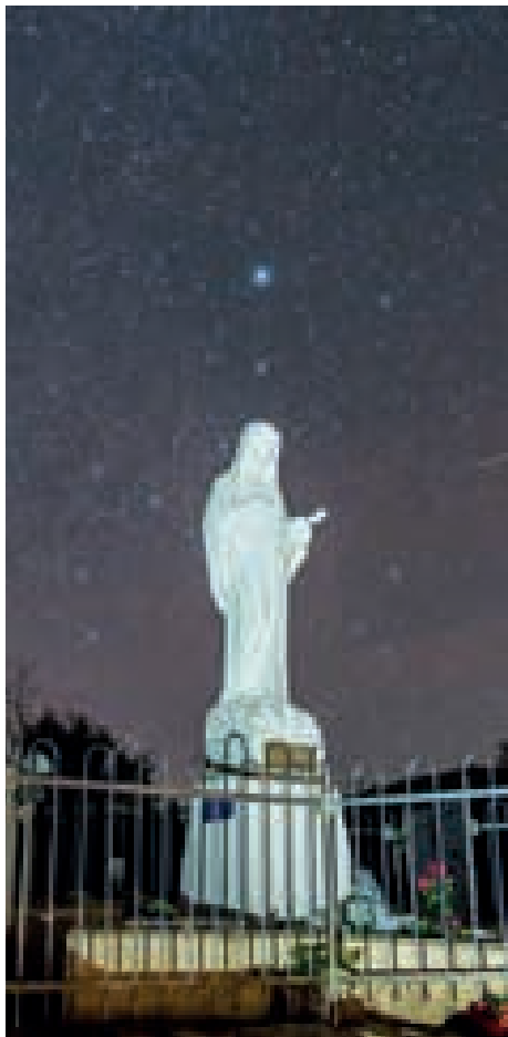
María, Madre nuestra