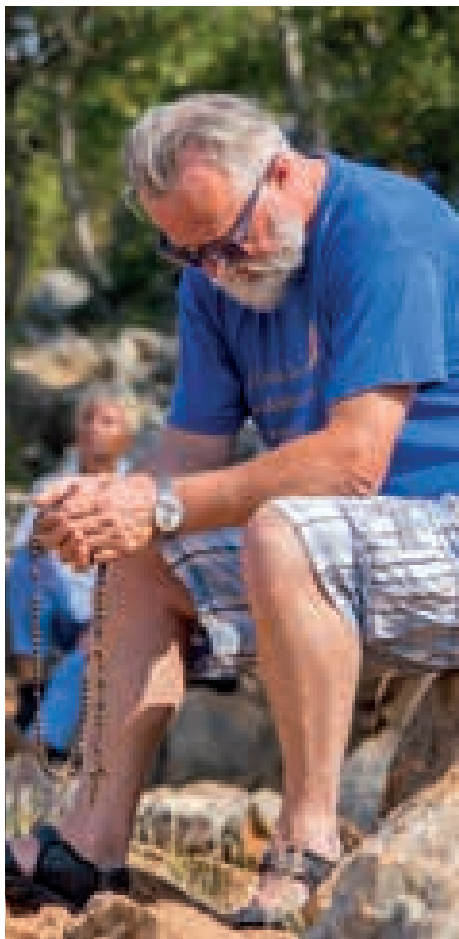
Rosario, ramos de flores en forma de oración