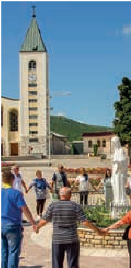
"Hoy venimos buena Madre de lugares diferentes"