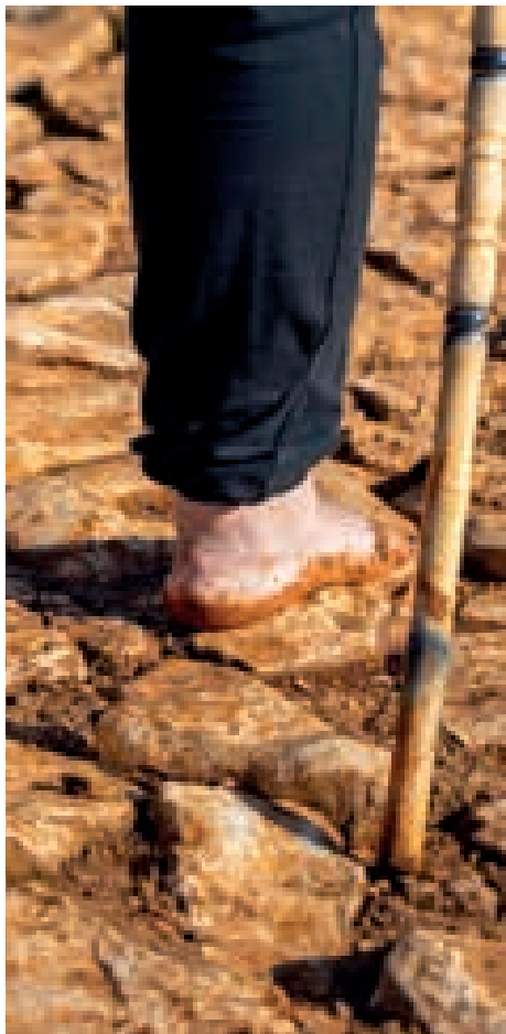
Oración y sacrificio