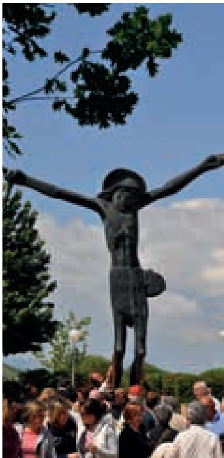
Resurrección y salvación