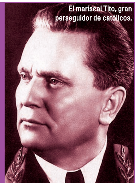
El mariscal Tito, gran perseguidor de católicos.

Bosnia y Herzegovina es un país de cuatro millones de habitantes de los que tres de ellos son musulmanes. Durante cuatro siglos, el Imperio Otomano persiguió a los católicos. Los pocos que consiguieron transmitir el Evangelio lo hicieron a escondidas, contando con los hermanos franciscanos que, vistiendo de incógnito y mezclándose entre las familias, lograron traer a la Iglesia hasta nuestros días tras sobrevivir al Imperio Otomano. Más tarde, cuando el clero ordinario regresó para reinstaurar las diócesis, la Iglesia fue perseguida de nuevo en diferentes escenarios: las guerras mundiales, la dictadura comunista de Tito y las guerras balcánicas de los años 90.